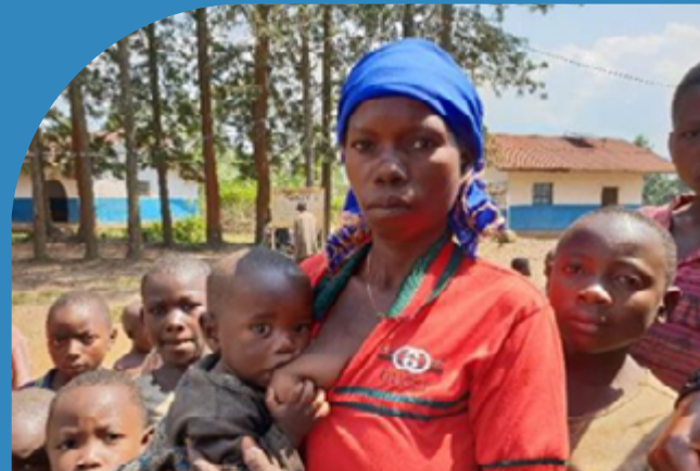
6 grossesses en moyenne par femme

Nos actions : les formations dédiées aux sages-femmes, un accompagnement pédagogique, microcrédit, la création d'emplois, la santé, la petite infrastructure.